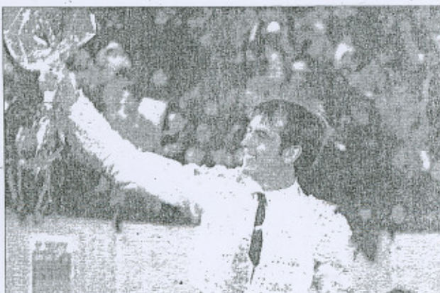
UN triunfo más para el "Cejas".