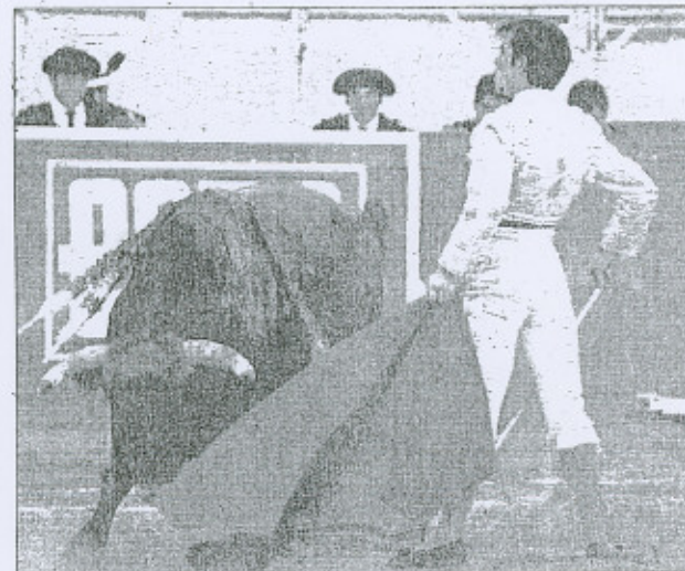
DESDEÑ hermoso de Macías.